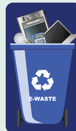
Μπλε κάδος: Μόνο ανακυκλώσιμες συσκευασίες (πλαστικές, χάρτινες, αλουμινένιες, λευκοσιδηρές & γυάλινες συσκευασίες)