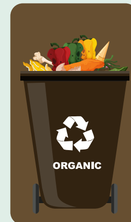
Καφέ κάδος: Οργανικά